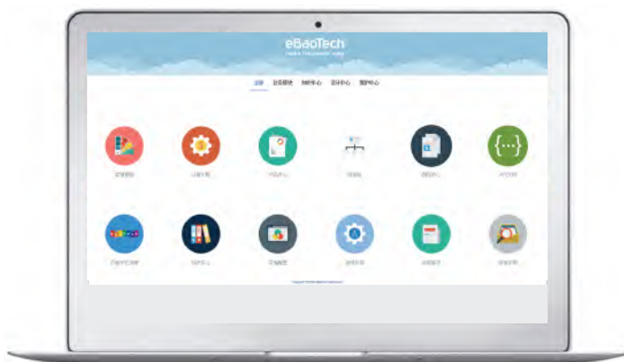
图一：易保云数字化产险核心登录页面