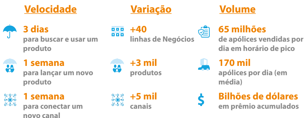
Figura 2. Status do InsureMO

O InsureMO, como um middleware do setor de seguros na nuvem, está potencializando as ofertas do eBaoCloud, bem como vários outros aplicativos. Acima estão os dados de negócios sobre o InsureMO.