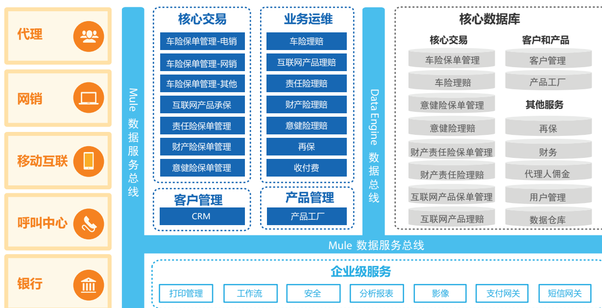
图二：技术方案—支持大规模分布式部署