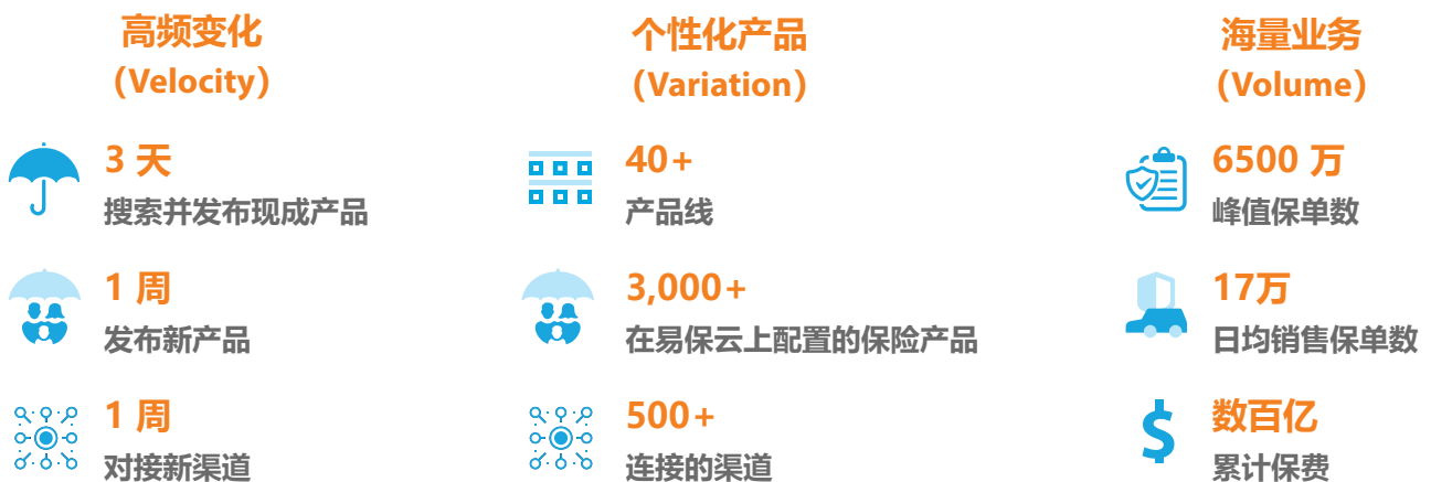
图二：易保云中台现状

易保云中台作为保险行业在云端的中间件，驱动易保云产品，并为保险公司及第三方构建各类保险相关应用提供技术赋能。以上是易保云中台的部分业务数据。请浏览 www.insuremo.com 了解更多信息。