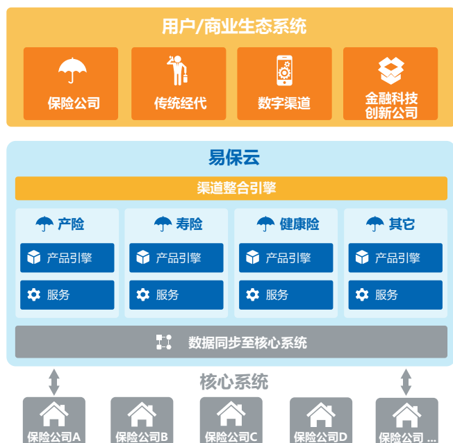
图二. 易保云业务视图

Collaborus ：面向MGA和小型保险公司，特别是Lloyd's市场投保人的全功能解决方案，支持移动端及PC端。主要功能包括：保障范围选择、保费报价、在线投保、支付等。