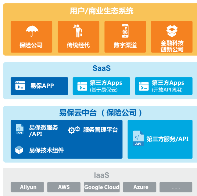
图三. 易保云技术视图