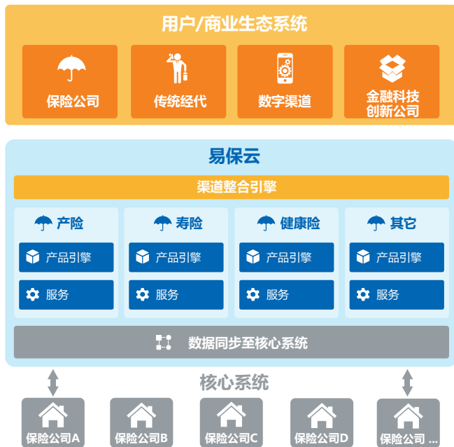
图二. 易保云业务视图

保险公司直销平台 ：面向保险公司的直销网站 (direct to consumer) 全功能解决方案，包括产品展示、保费计算、在线投保、服务提交等。