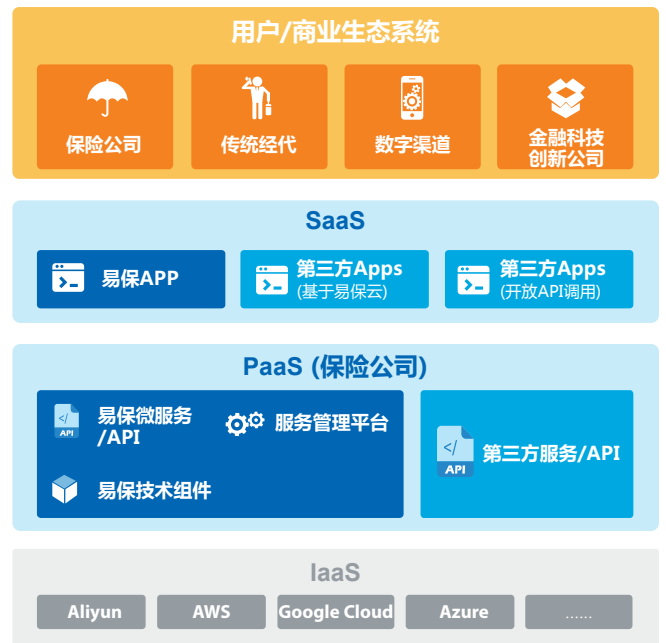
图三. 易保云技术视图